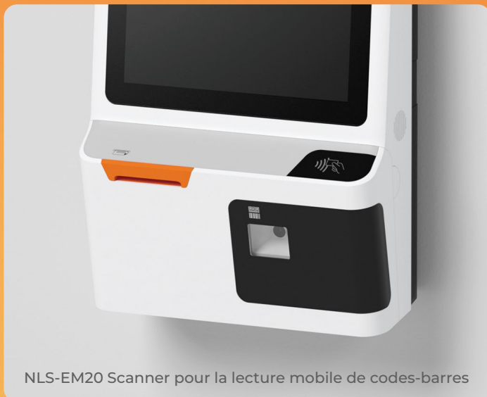
NLS-EM20 Scanner pour la lecture mobile de codes-barres